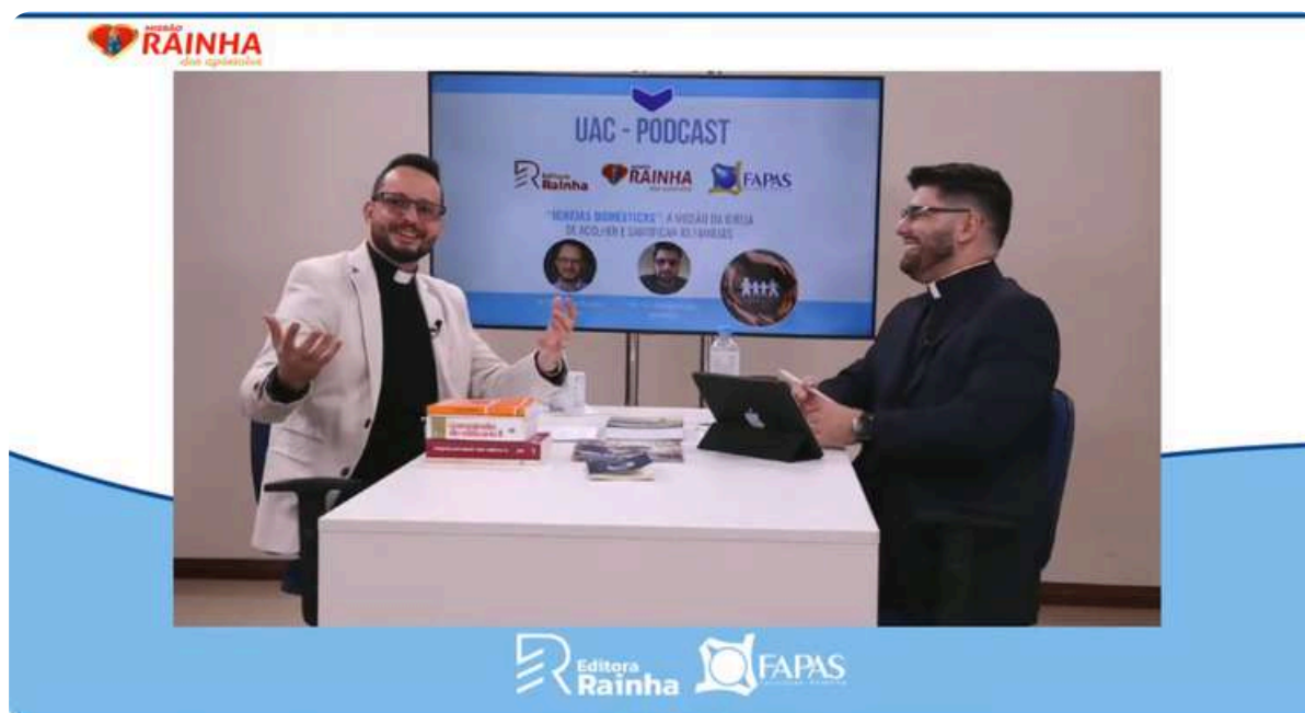
"Igrejas Domésticas": A Missão da Igreja de Acolher e Santificar as Famílias