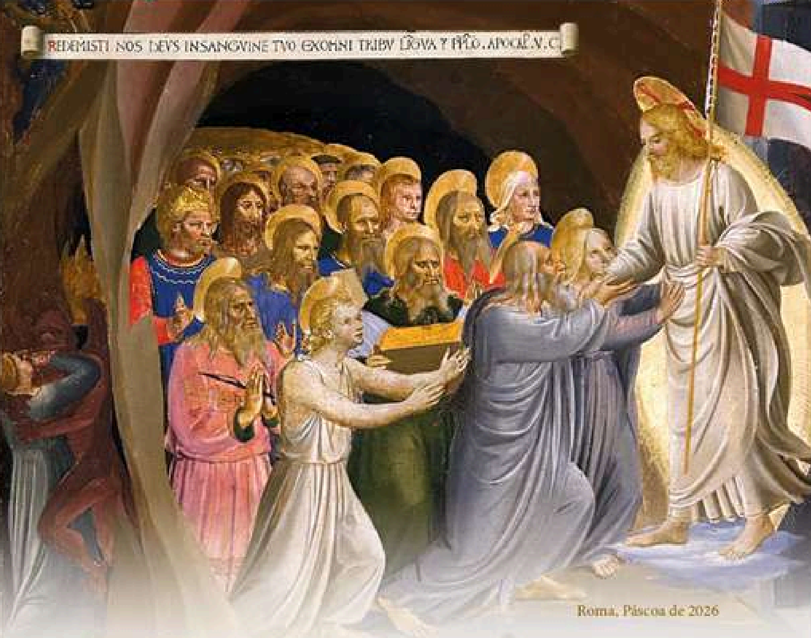
Roma, Páscoa de 2026