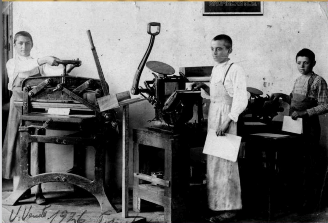
Início em 1923 - Vale Vêneto