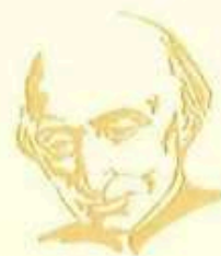
S. Vincenzo Pallotti